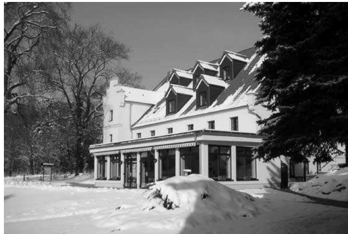
Heimvolkshochschule (HVHS) am Seddiner See

VON ANDREA FAULSEIT, JOHANNA GERNENTZ UND ULRIKE KRON, Projekt LEWUS